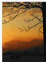
表紙写真 ビッグスワン