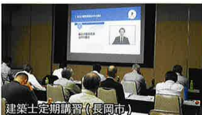
建築士定期講習（長岡市）