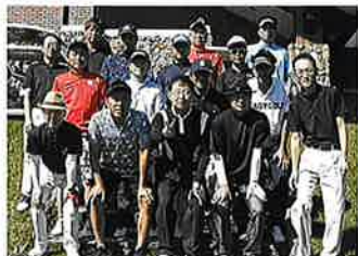
上越支部ゴルフコンペ