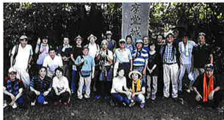
中越支部ハイキング(護摩堂山)