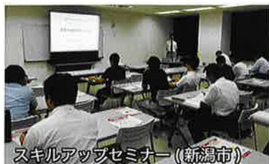
スキルアップセミナー（新潟市）