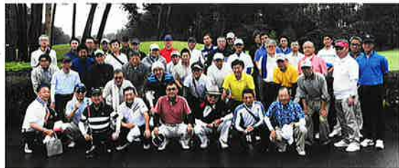
下越支部ゴルフコンペ