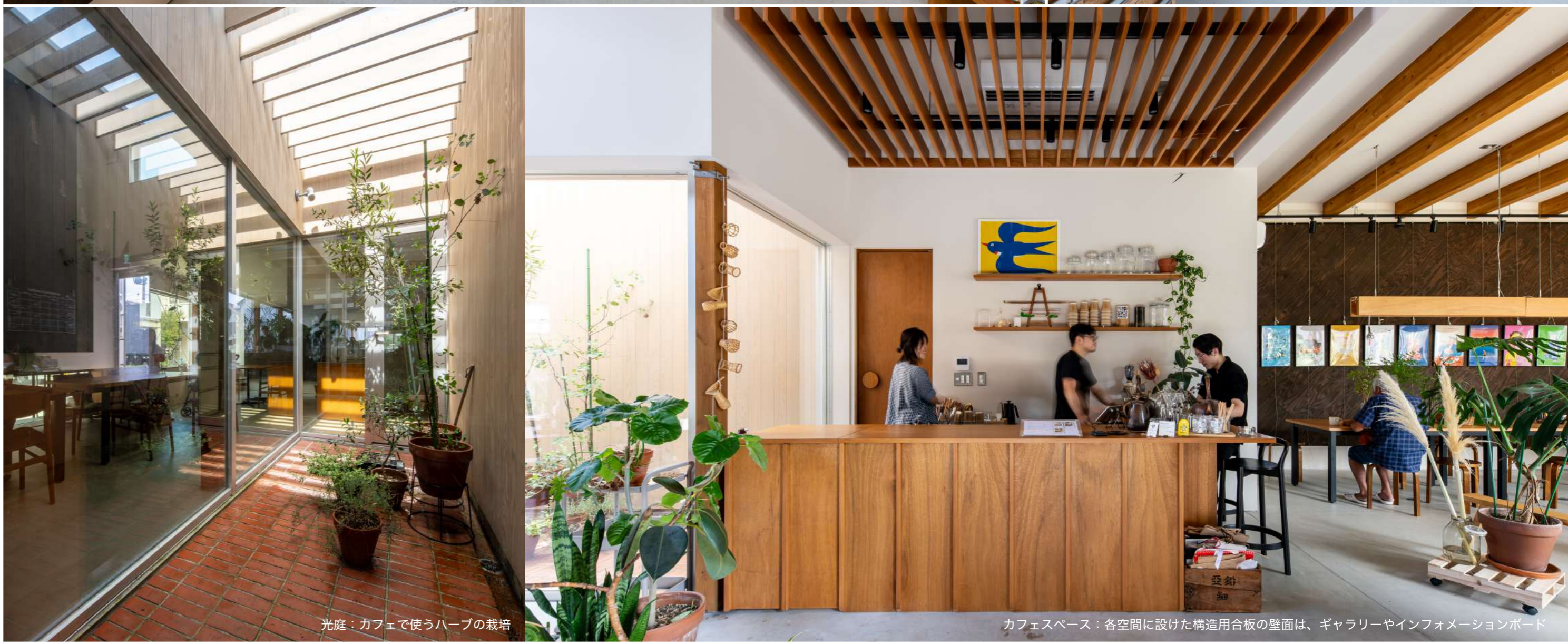
光庭：カフェで使うハーブの栽培