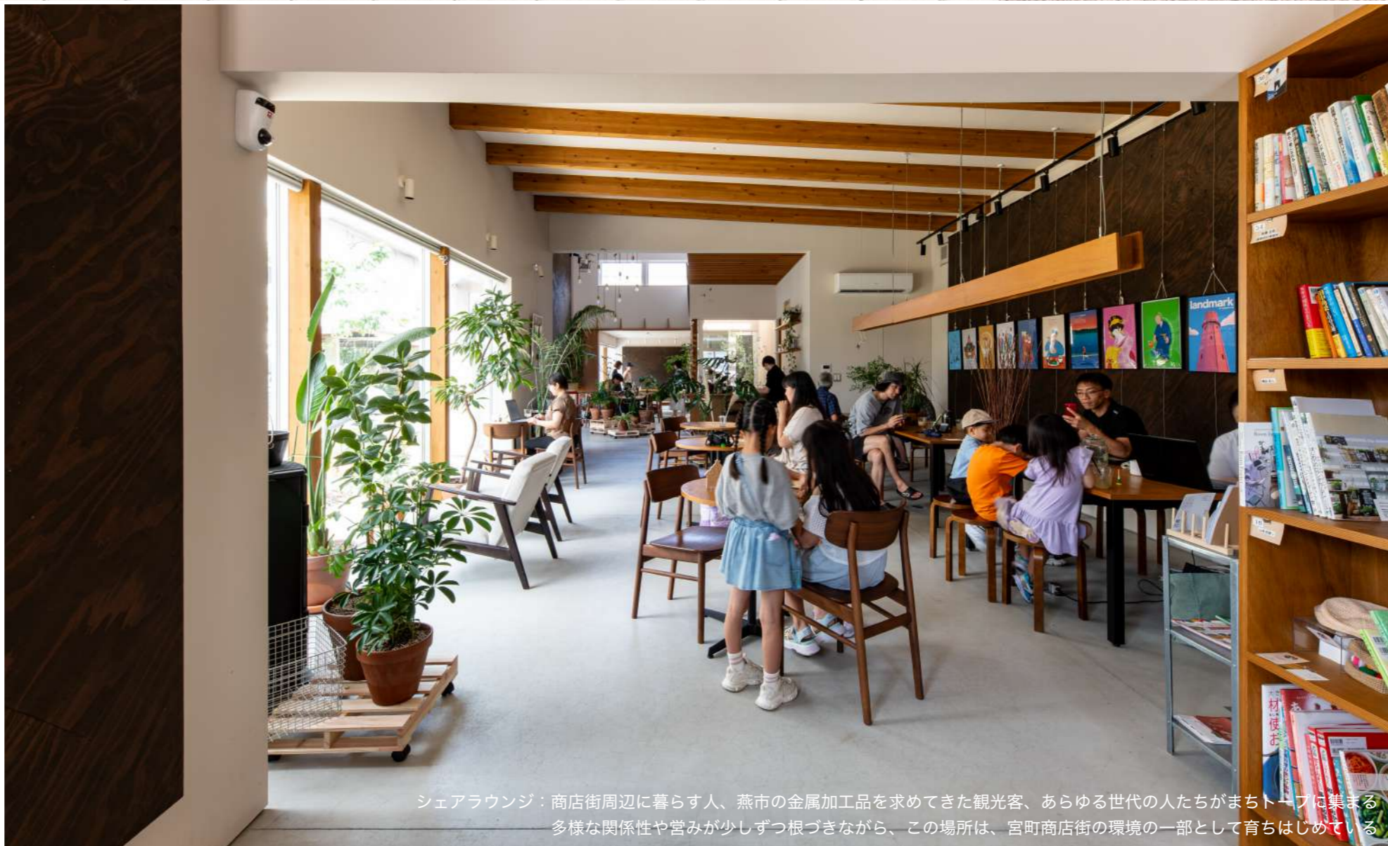
シェアラウンジ：商店街周辺に暮らす人、燕市の金属加工品を求めてきた観光客、あらゆる世代の人たちがまちトープに集まる。多様な関係性や営みが少しずつ根づきながら、この場所は、宮町商店街の環境の一部として育ちはじめた。

民営民営でありながら公共性の高い施設として注目され県内外から多くの視察者が訪れている