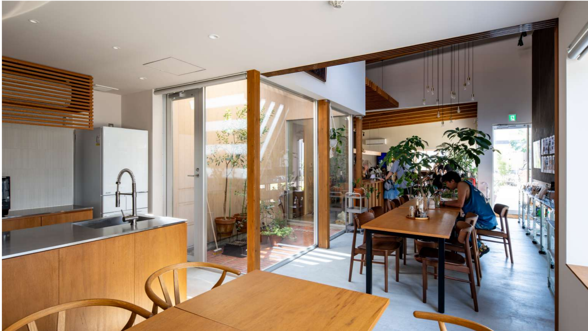
キッチンスペース：レンタルキッチンや料理教室、燕三条産キッチン用品等の撮影スタジオ