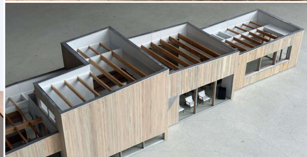
切妻：異なる天井高さやパラペット傾斜をもつ4つのボリューム