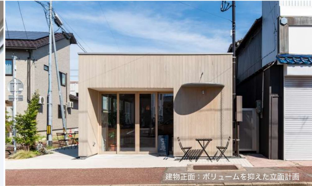
建物正面：ボリュームを抑えた立面計画