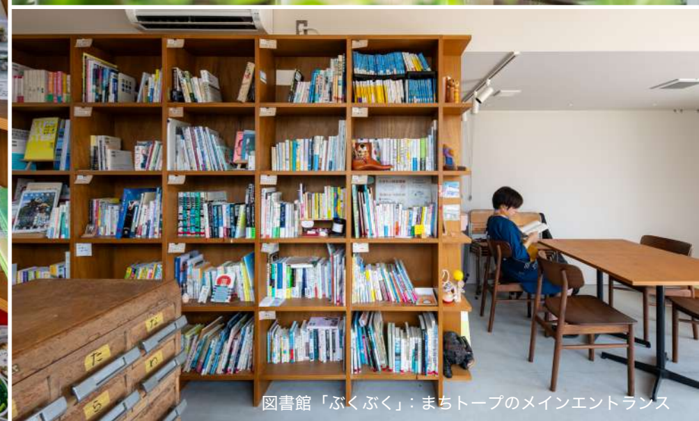
図書館「ぶくぶく」：まちトープのメインエントランス