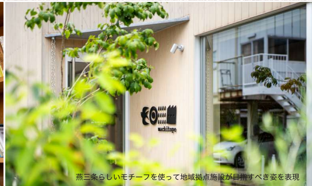
燕三条らしいモチーフを使って地域拠点施設が目指すべき姿を表現