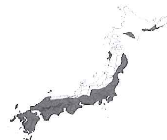
多雪区域以外の区域