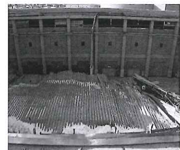
体育館の屋根崩落被害(埼玉県)